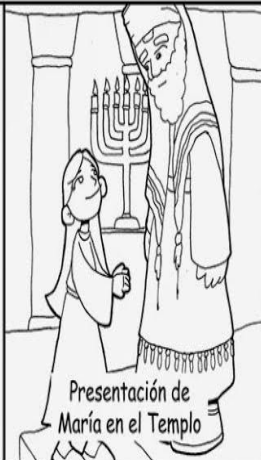
Presentación de María en el Templo