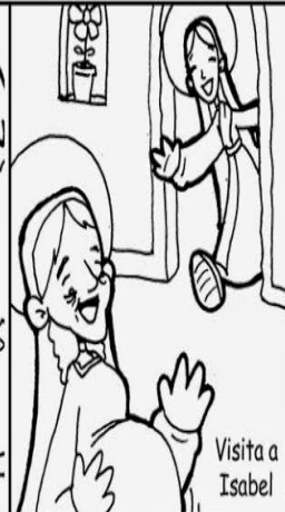
Visita a Isabel