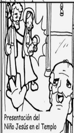
Presentación del Niño Jesús en el Templo