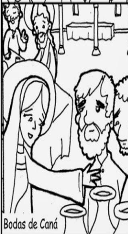
Bodas de Caná