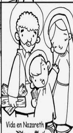
Vida en Nazareth