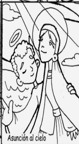
Asunción al cielo