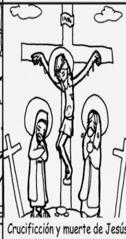
Crucifixión y muerte de Jesús