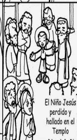
El Niño Jesús perdido y hallado en el Templo