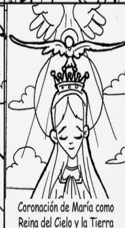
Coronación de María como Reina del Cielo y la Tierra