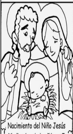
Nacimiento del Niño Jesús